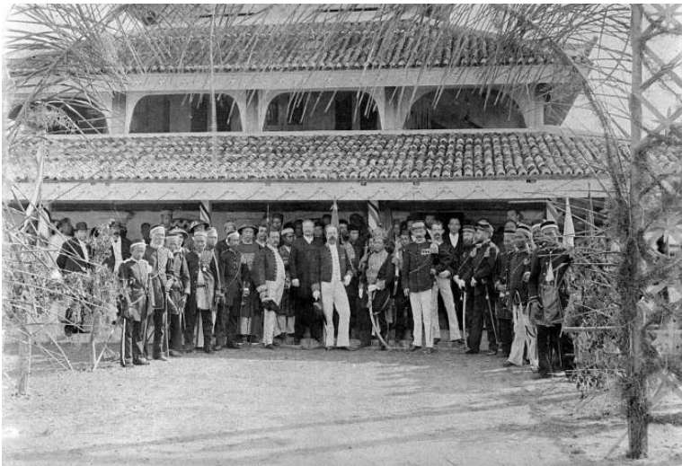
Foto penobatan Sultan Siak, Sultan Syarif Hasyim Abdul Jalil Saifuddin, 1889. dihadiri para pejabat kolonial Belanda, termasuk

Sejarah Siak menjadi saksi bahwa klan Ba'alwi tidak hanya datang untuk menghindari kelaparan di negerinya melainkan juga untuk berkuasa dengan cara menggulingkan raja-raja pribumi. Ironisnya, setelah kekuasaan diraih, mereka justru memosisikan diri sebagai 'vasal' atau pelayan setia Belanda, membuktikan bahwa ambisi kekuasaan mereka jauh lebih besar daripada solidaritas terhadap bangsa yang mereka tumpangi.