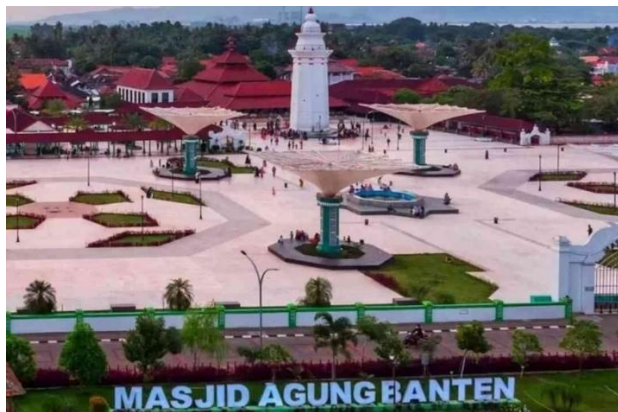
Foto Masjid Kesultanan Banten (2022) pertama kali didirikan oleh Sultan Maulana Hasanudin (1556) yang masih berdiri sampai sekarang

Banyak kerajaan dan daerah yang bisa diinfiltrasi oleh Klan Baalwi di Nusantara seperti Siak, Sumenep, Palembang, Mempawah, Ternate dan Lombok. Tetapi menurut Van den Berg ada dua kesultanan di Jawa yang tidak bisa dipengaruhi Klan Baalwi yaitu Banten dan Mataram.