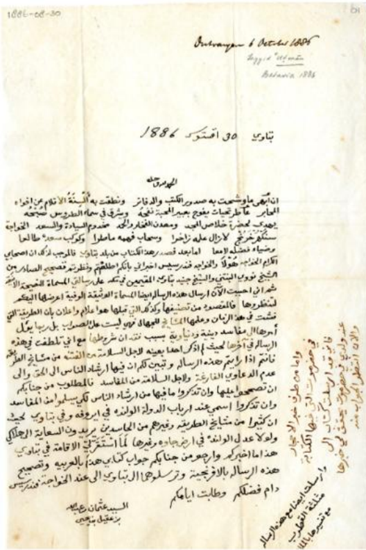
Tangkapan layar surat Usman bin Yahya kepada C. Snouck Hurgronje pada 30 Agustus 1886 25

massal di kalangan ulama pribumi dan pemimpin tarekat yang merupakan motor perlawanan rakyat. Usman bukan jatuh karena "iri hati" secara personal, melainkan karena ia dianggap sebagai pengkhianat oleh komunitasnya sendiri.